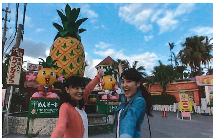
(ナゴパイナップルパーク)

沖縄県北部・名護市内の高台にあるナゴパイナップルパーク。青い空の下、パイナップルの畑を眺めて散策ができたり、試食ができたり、土産物を選んだりと楽しい時間が過ごせる人気のスポットだ。